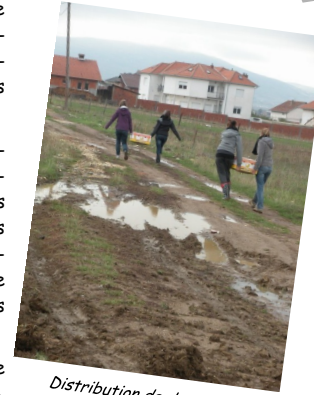
Distribution de denrées au Kosovo — octobre 2012

Un voyage, une aventure... que l'équipe vous invite à partager. Un grand merci de votre soutien !