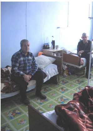
Patients à l'hôpital d'Orhei—février 08

seront également acquises, avec l'argent que nous aurons récolté.