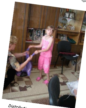
Distribution de matériel scolaire — juillet 09

Durant cette année de préparatifs, nous aurons la possibilité de correspondre avec une jeune de notre village d'accueil.